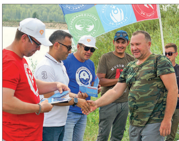
Участники состязаний по рыбной ловле отлично проводят время на берегу водоема в дружной компании коллег.