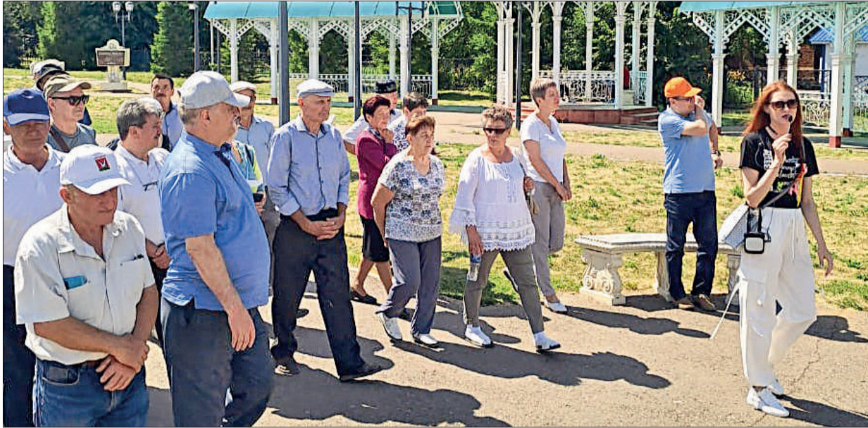
Ветераны Предприятия АктюбинскРемСервис стали участниками экскурсионной поездки, организованной родным предприятием.