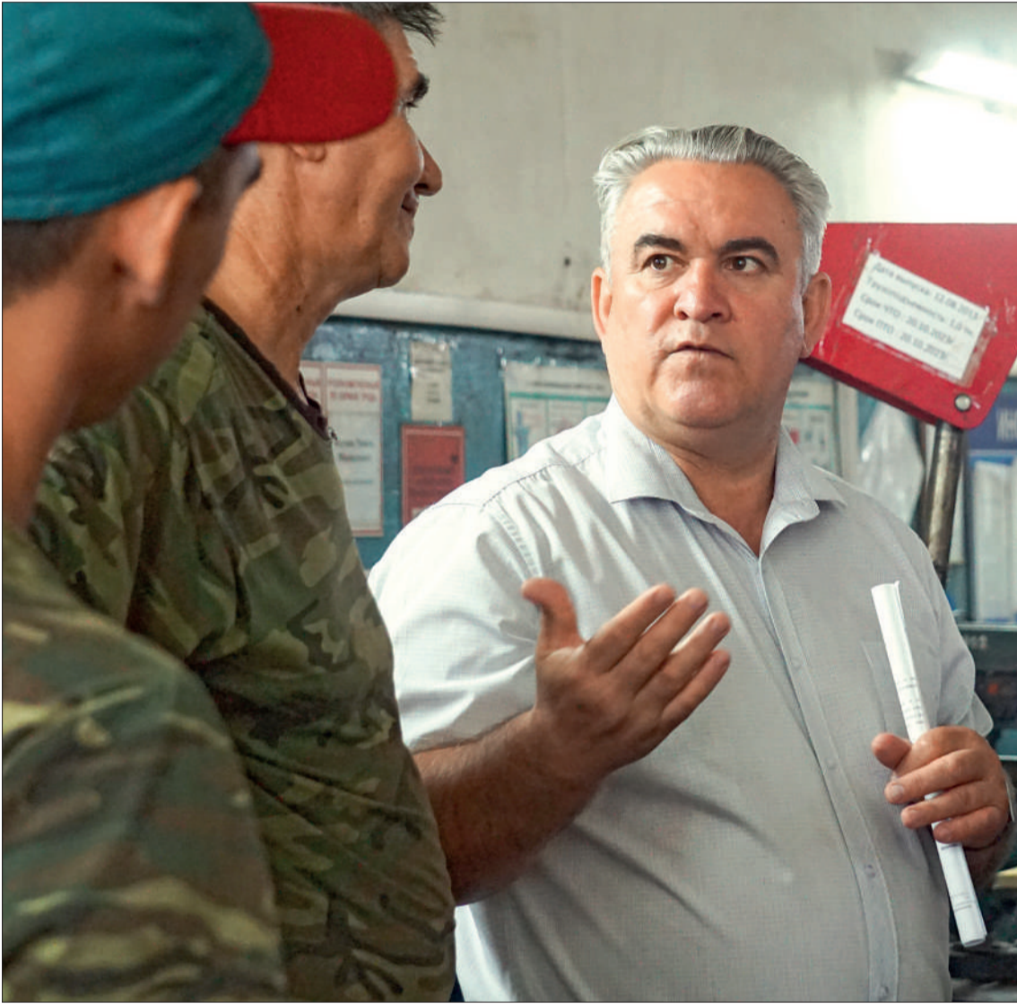
Участники семинара по «Бережливому производству» обсуждают примеры эффективного применения его инструментов.