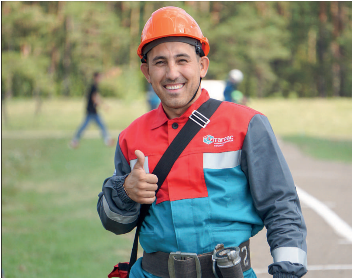
На полигоне Кама-Исмагилово работники компании «Таграс-РС» принимают участие в соревнованиях по пожарно-прикладному спорту.