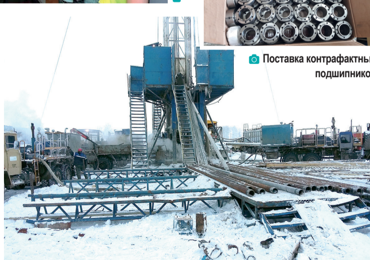
Поиск похищенного долота

В цехах №5, №6 ООО «Сервис НПО» и Карабашком участке цеха № 8 ООО «РИНПО» проведены дополнительные мероприятия по технической укреплённости объектов в целях недопущения хищения товарно-материальных ценностей (ТМЦ).