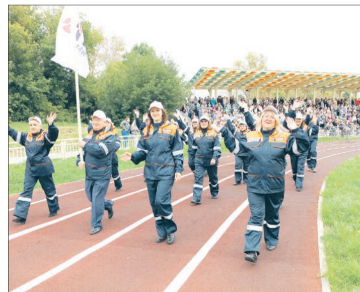
Парад трудовых коллективов в Бугульме

спецтехники наряду с самым современным транспортом нефтяников. Ретро-автомобили тоже забыты не были: с чего начиналось освоение недр региона, нефтяники помнят и историю свою чтут.