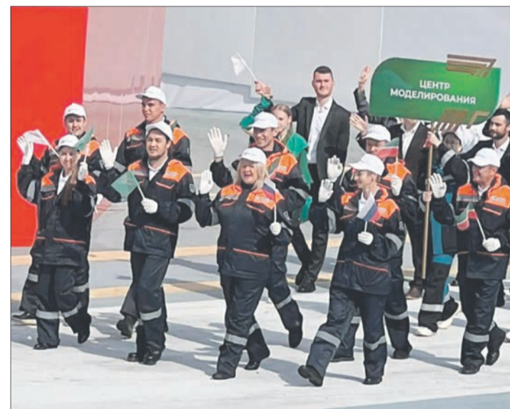
Геофизики на параде в Альметьевске