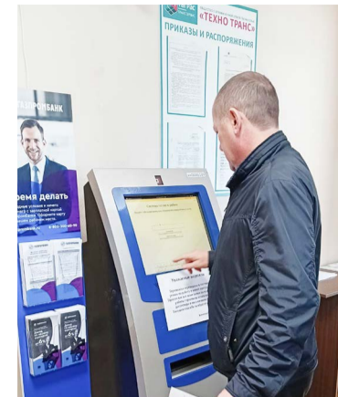
📷 Выдача путевого листа на терминале с ПО WDS

Преимущества новой информационной системы WDS «Управление автоперевозками»: