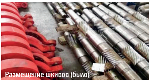
Размещение шкивов (было)