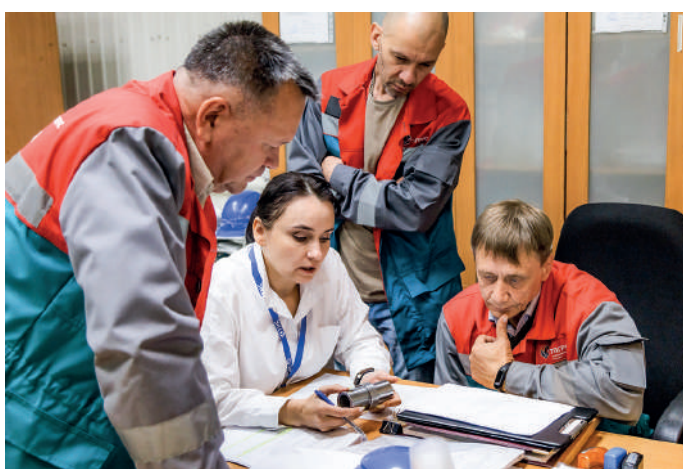
Определяется лучший токарь