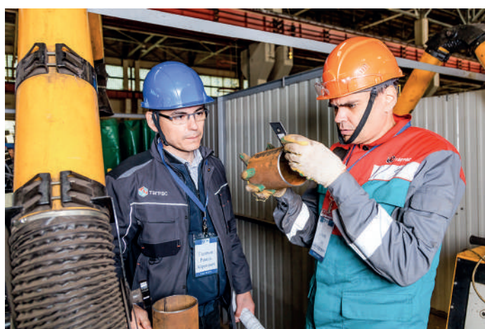
Чей сварной шов более качественный?