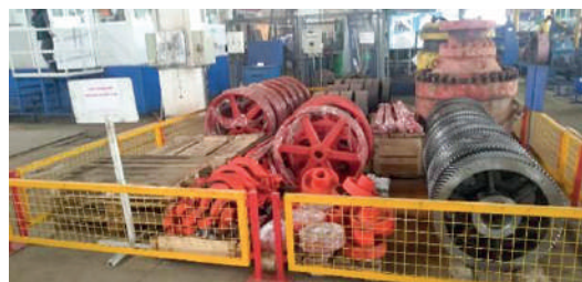
Размещение валов (стало)