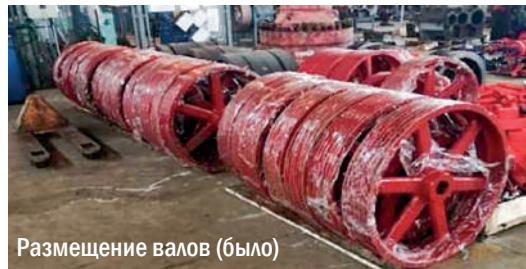
Размещение валов (было)

и установлено ограждение в зоне риска. А также разработана КД и изготовлен стеллаж для складирования валов, согласно требованиям промышленной безопасности и охраны труда, и обеспечено хранение ТМЦ на складе.