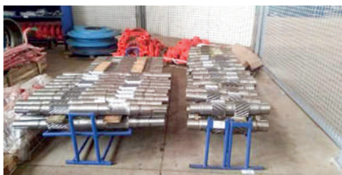
Размещение шкивов (стало)