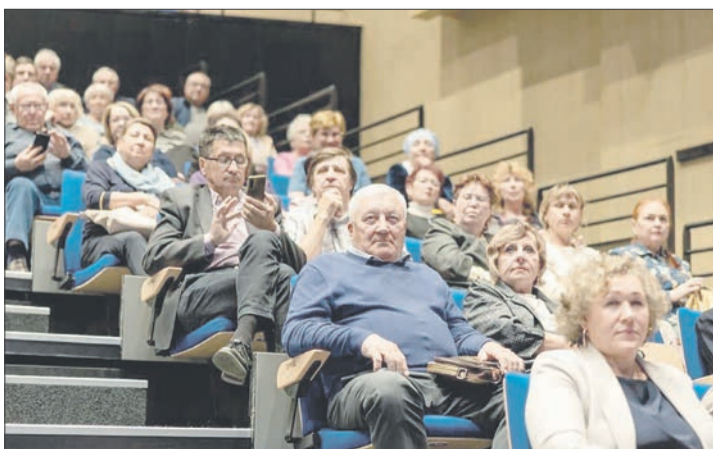
На семинаре по основам кибербезопасности и цифровой гигиене