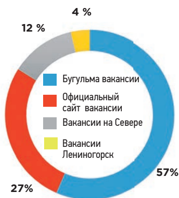
Запросы о вакансиях в ТНГ-Групп за последний месяц в поисковике Яндекс

В рамках стратегии развития корпоративного управления в ТНГ-Групп реализован про-