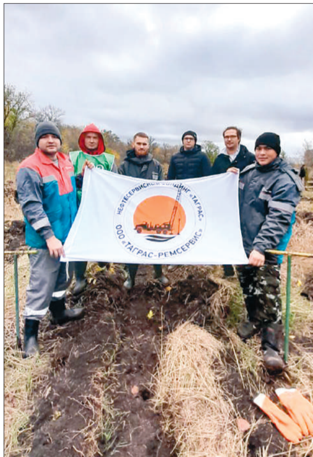
Молодые работники компании приняли активное участие в экологической акции по посадке саженцев деревьев.