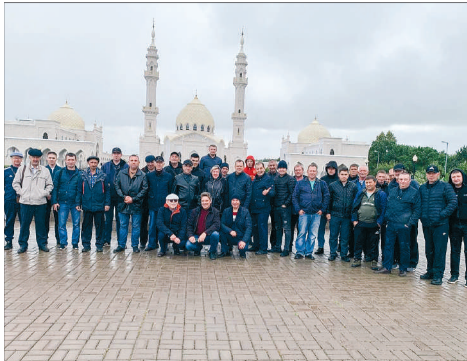
Коллектив ООО «РемСервисТранспорт» на экскурсии в Древнем Булгаре.