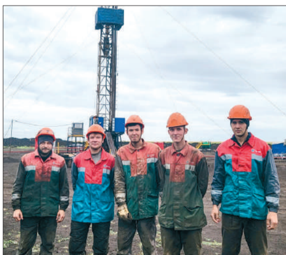
Бригаде № 17 удается достигать высоких скоростей проходки благодаря четкой организации работ.