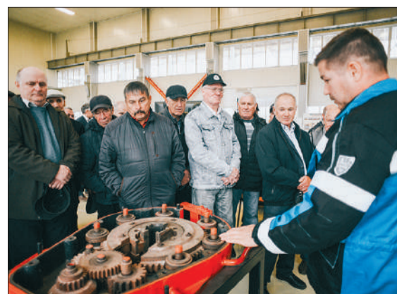
Ветераны принимают участие во встрече в честь Дня пожилых людей.