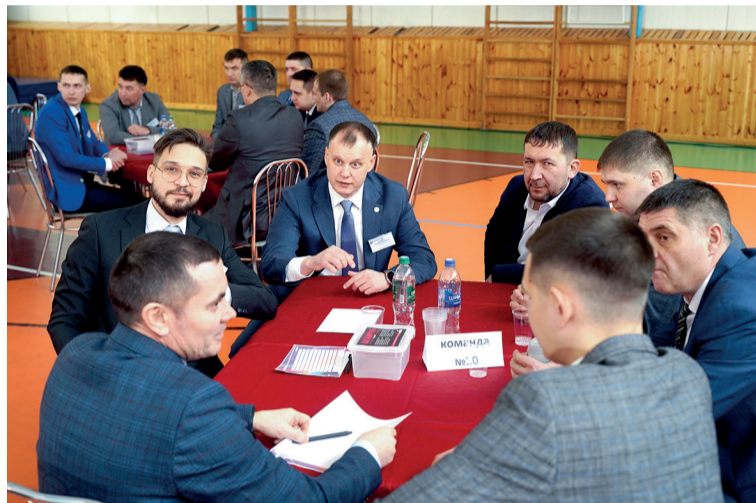
Команда победителей викторины ReQuizit