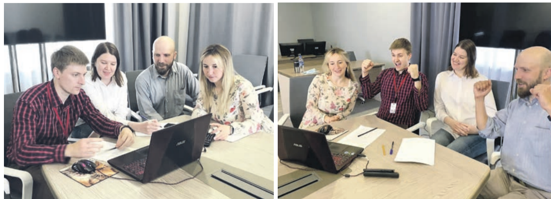
На фото: участники команды TNG-Alpha

20 мая в онлайн-формате прошёл отборочный тур интеллектуальной игры «На бакинских приисках», организатором которой выступил Нефтегазстройпрофсоюз России. Команда ТНГ-Групп, TNG-Alpha, став одной из сильнейших, обеспечила себе выход в финал и возможность побороться за главный приз.