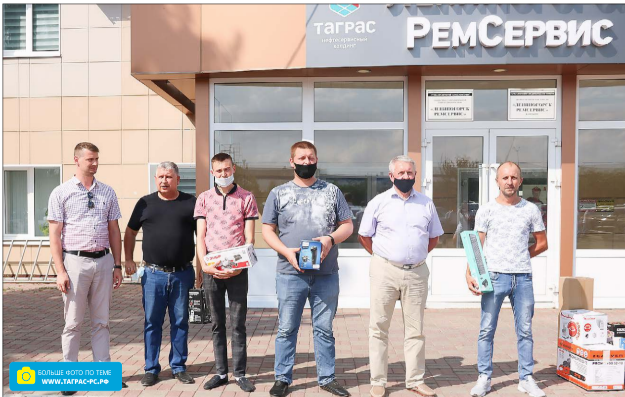
Победители розыгрыша призов за вакцинацию от COVID-19 и здоровье обезопасили, и приятные подарки получили.