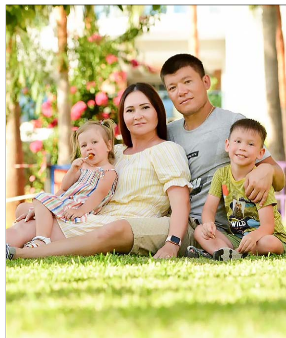
Счастливые семьи работников ООО «ЛениногорскРемСервис».