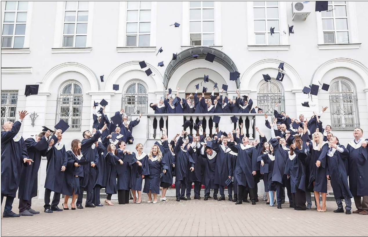
На церемонии вручения дипломов Высшей школы бизнеса КФУ.