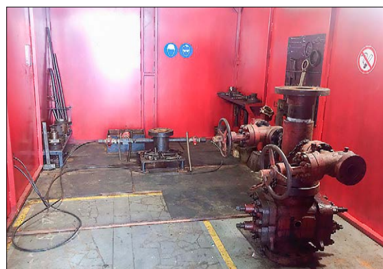
Модернизированный опрессовочный стенд.