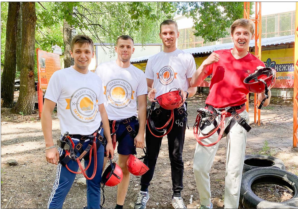
Герои третьего уровня тропы мужества ощущают безграничный прилив сил и уверенность в своих силах.

еще больше сплотить команду, развить корпоративную культуру, участвовать в акции по продвижению бренда компании (корпоративные корреспонденты на всех мероприятиях появляются в фирменных футболках с изображением эмблемы компании «ТаграС-РемСервис»), а также по традиции провести в общественном месте танцевальный флешмоб, привлекая в него все большее количество участников движения корпоративных корреспондентов.