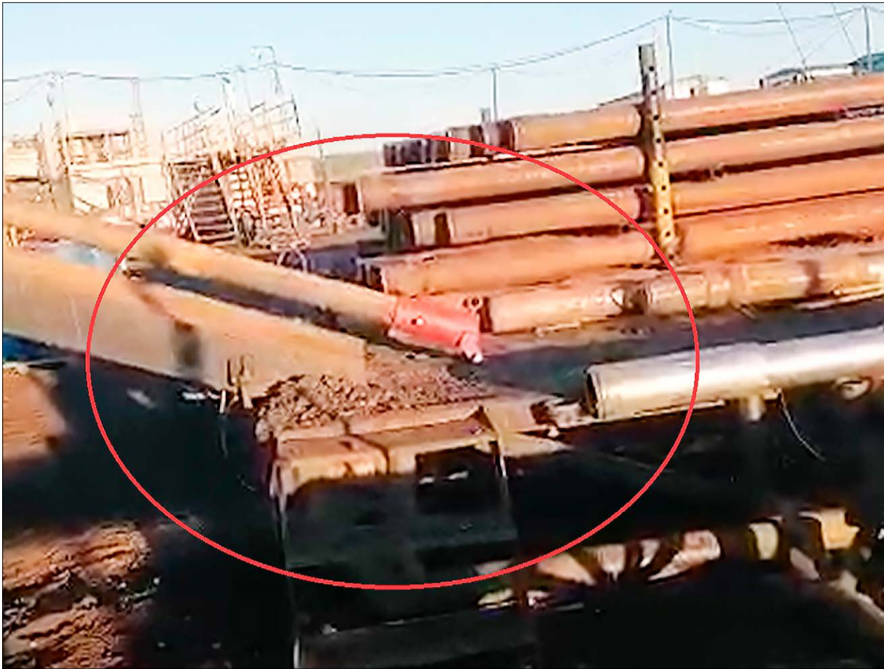
«Колпак» на буровой призван облегчить и обезопасить труд персонала.