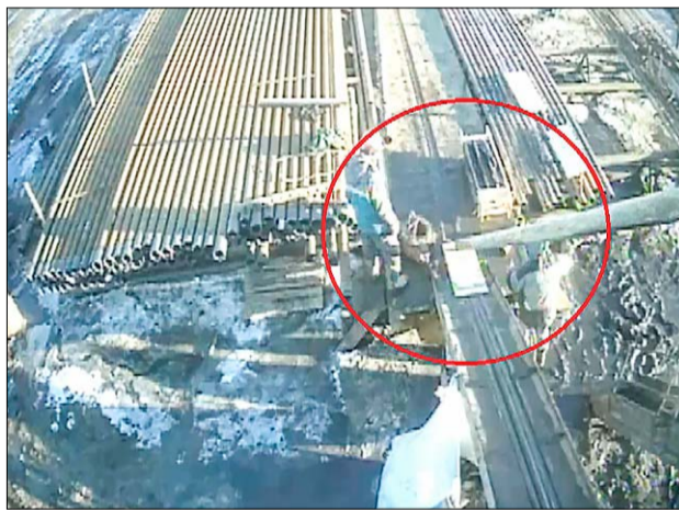
Работники в опасной зоне при производстве работ по выбросу керноприемного устройства на мостки.

По инициативе специалистов Предприятия ЗБС-Сервис сервисная компания ООО «Перекрыватель», оказывающая услуги по интегрированному сервису (услуги по инженерному сопровождению долот, забойных двигателей, отбору керна и др.), разработала чертеж и изготовила «Колпак». При использовании данного устройства планируется облегчить и самое главное – обезопасить работы по выбросу керноприемно-