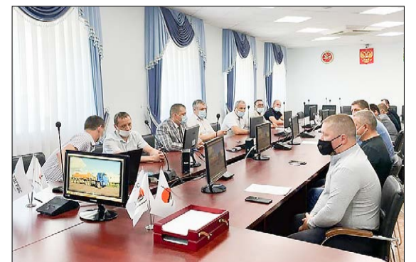
Награждение лучших по итогам рейтинга. / ФОТО: ДМИТРИЙ ИЛЬИН, «ЕВС».