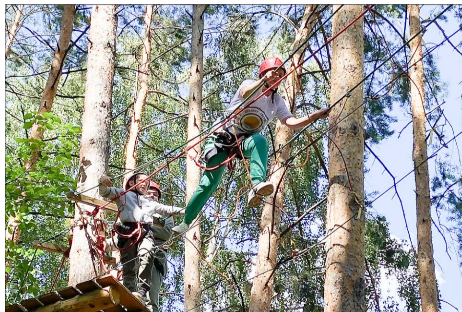
Корпоративные корреспонденты с успехом справляются с самими сложными преградами на пути к победе над своими страхами.

вочной тропе (три уровня сложности), обеда в дружеской обстановке с обсуждением планов по проведению дальнейших корпоративных мероприятий и танцевального флешмоба под популярную песню «Мы – команда», ставшего визитной карточкой корпоративных корреспондентов компании «ТаграС-РемСервис».