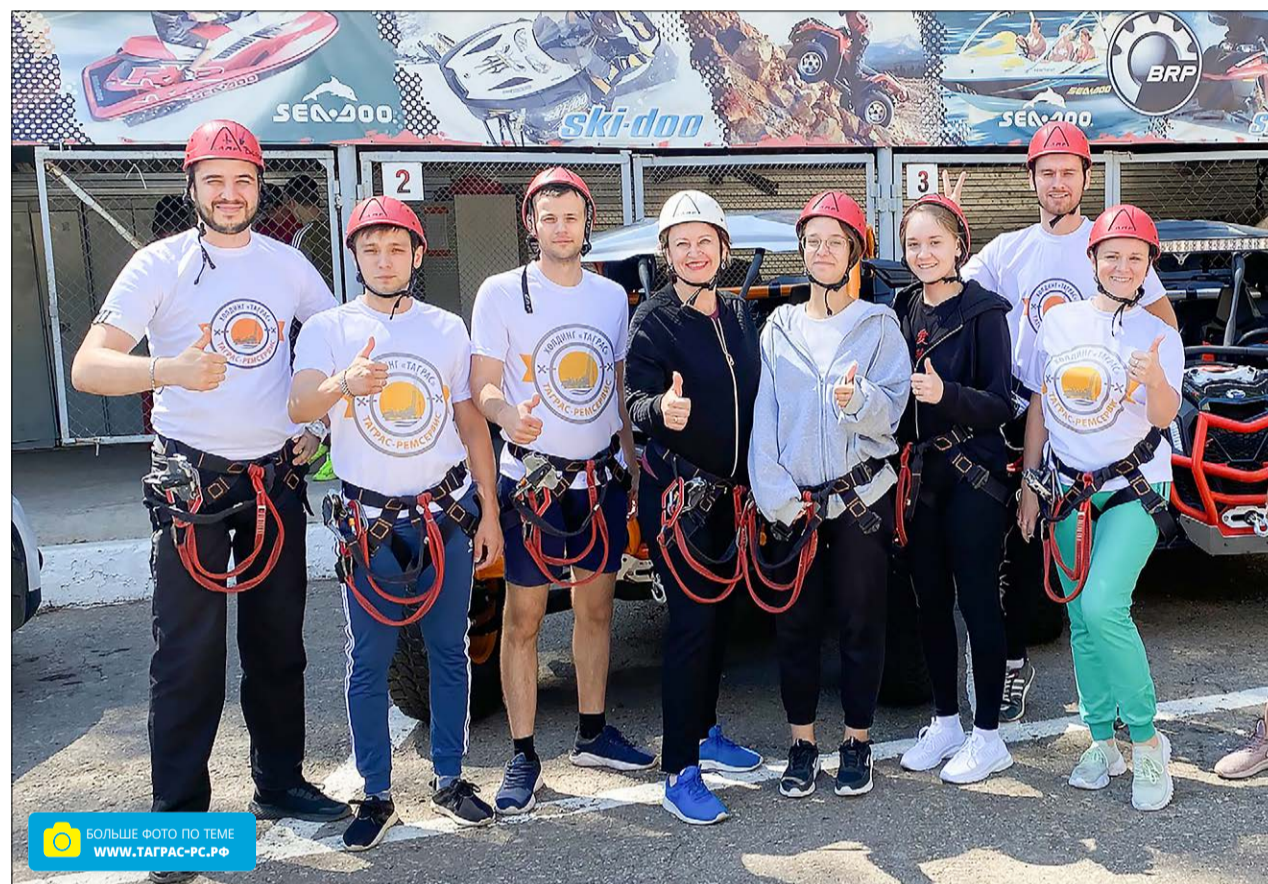
На базе «Снежинка» собрались представители нашей компании, ООО «ТрансСервис», студенты АГНИ и АПТ.