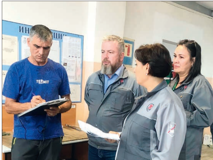
Специальная оценка условий труда в УГС. В комиссиях по проведению СОУТ принимают участие председатели цеховых профсоюзных комитетов и уполномоченные по охране труда.

Одним из главных направлений деятельности цехкома является контроль выполнения норм и правил, направленных на обеспечение безопасных условий труда, сохранение жизни и здоровья работников, а также защиту окружающей среды.