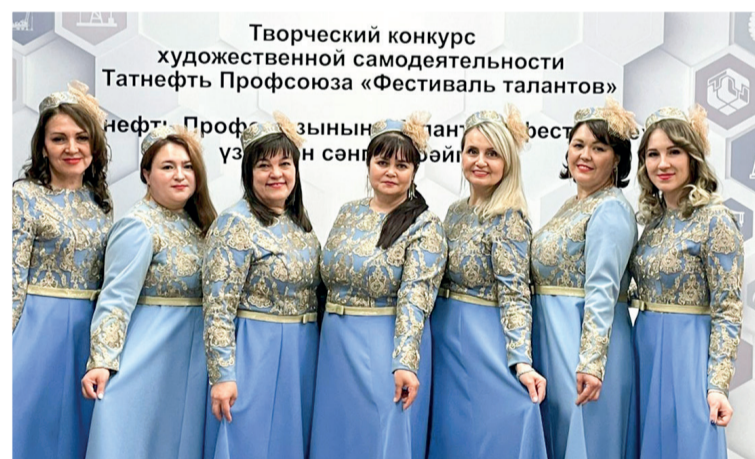
Женский вокальный ансамбль «Гузэл кызлар»

В номинации «Вокал. Ансамбли» было заявлено более 10 команд-участников. ООО «УК