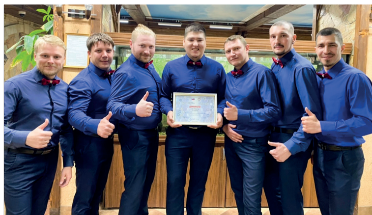
Мужской вокальный ансамбль «Позитив»