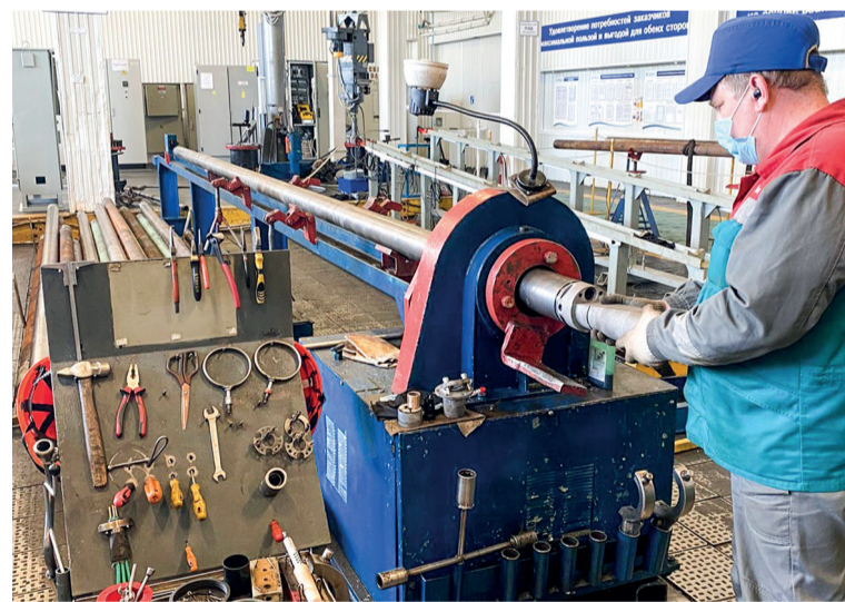
Вентильный электродвигатель 4ВЭД40-117-3.0

В роторе двигателя ПВЭД размещаются постоянные магниты, создающие магнитное поле. В зависимости от количества магнитов, расположенных в поперечном сечении ротора, двигатель будет иметь соответствующее количество полюсов. Ротор погружного электродвигателя, выпускаемого нашей