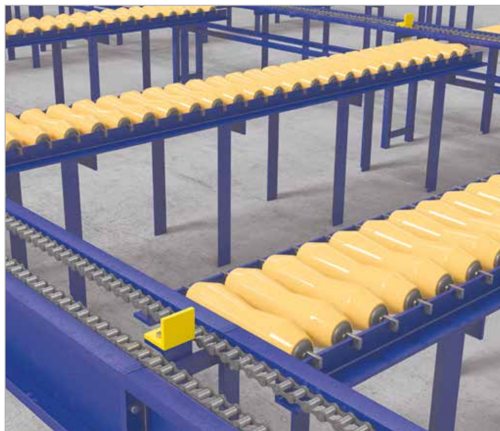
Звание лауреата было присвоено линии по диагностике и ремонту НКТ, насосных штанг «ТМС HighTech SR-Line»

Конструкторы компании постоянно повышают свой профессиональный уровень,