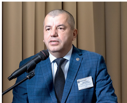
17 февраля в ДОЛ «Солнечный» прошёл Слёт мастеров Группы компаний «Система-Сервис».

В настоящее время идёт процесс согласования цен для дальнейшего составления программы испытаний.