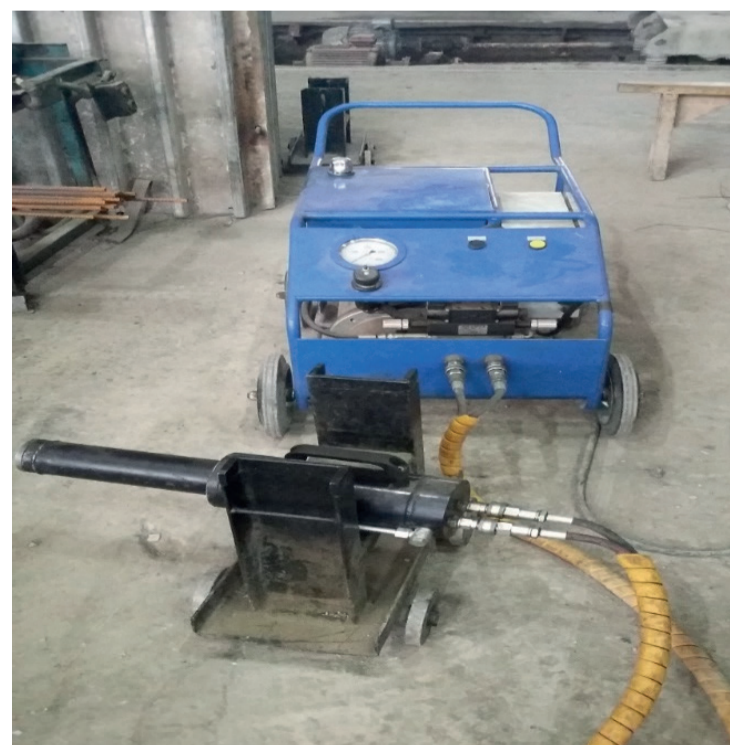
Механический способ натяжения арматуры