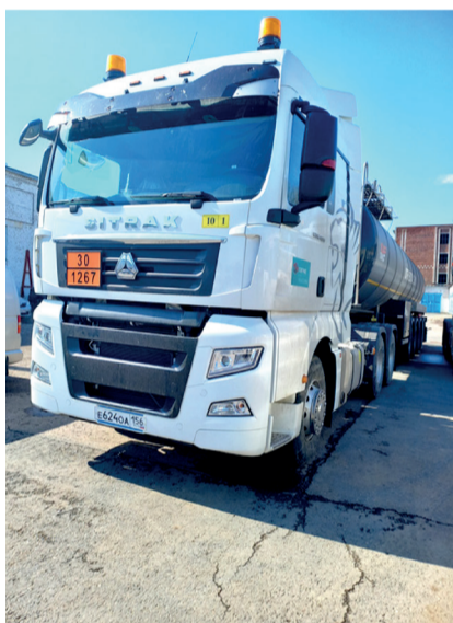
Альметьевское УТТ-3 – 2 ед., ТрансСервисАзнакаево – 1 ед.

В марте-апреле 2023 года для перевозки нефти в ООО «Таграс-ТрансСервис» приобретено 12 единиц седельных тягачей марки SITRAK C7H с колесной формулой 4x2. Транспорт распределен по обществам: ТрансСервисБавлы – 3 ед., УТТ Бугульминское – 2 ед., ТрансСервисСулеево – 2 ед., Транс-СервисЕлабуга – 2 ед., АТЦ