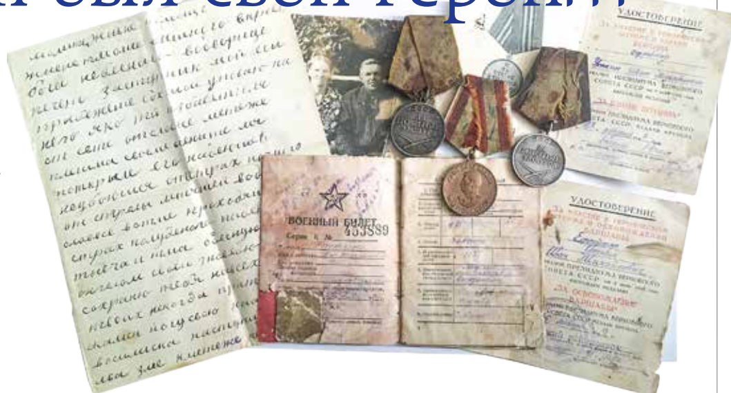
теперь тоже семейная реликвия.