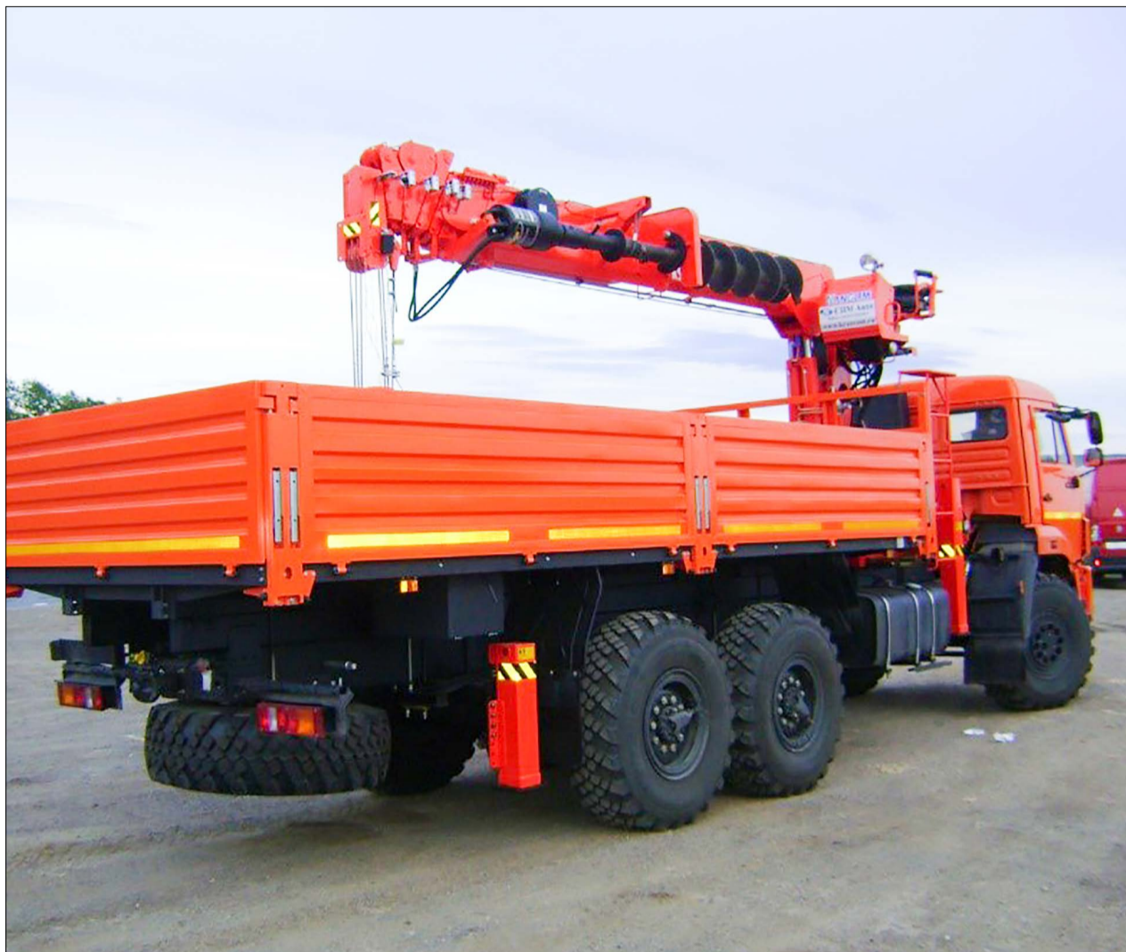
Новая установка позволяет экономить, повышает уровень безопасности при ее эксплуатации обслуживающим персоналом.