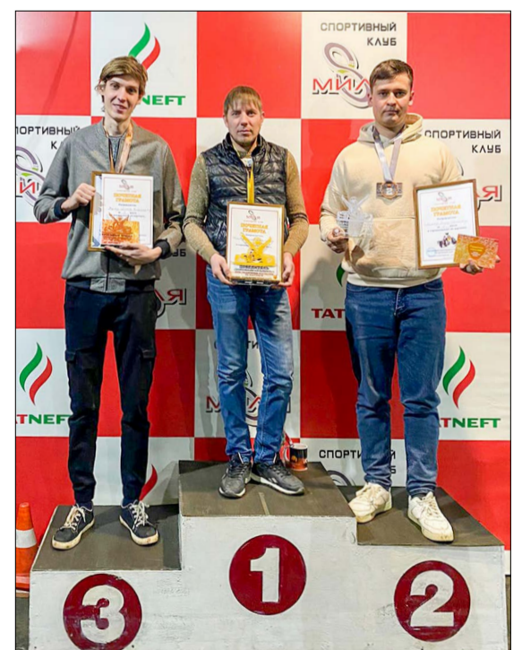
Победители праздничного заезда на картах.