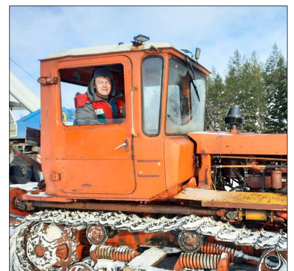
Спецтехника — спасение от сильных снегопадов.