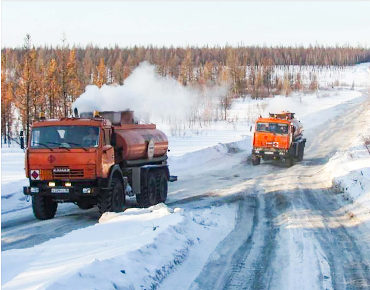
Спецтехника на скользкой зимней дороге требует особого мастерства водителя.