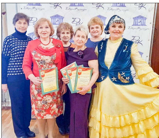
Дорогие ветераны — участники и лауреаты творческого фестиваля.