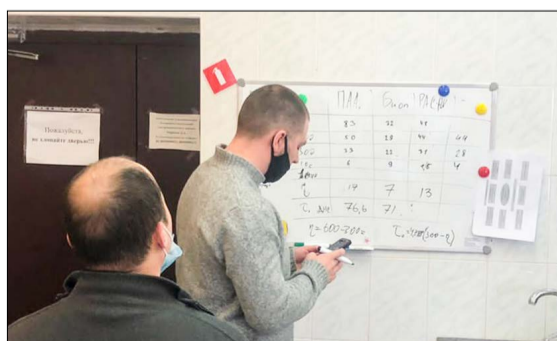
Работники компании проходят обучение в лаборатории ТатНИПИнефть.