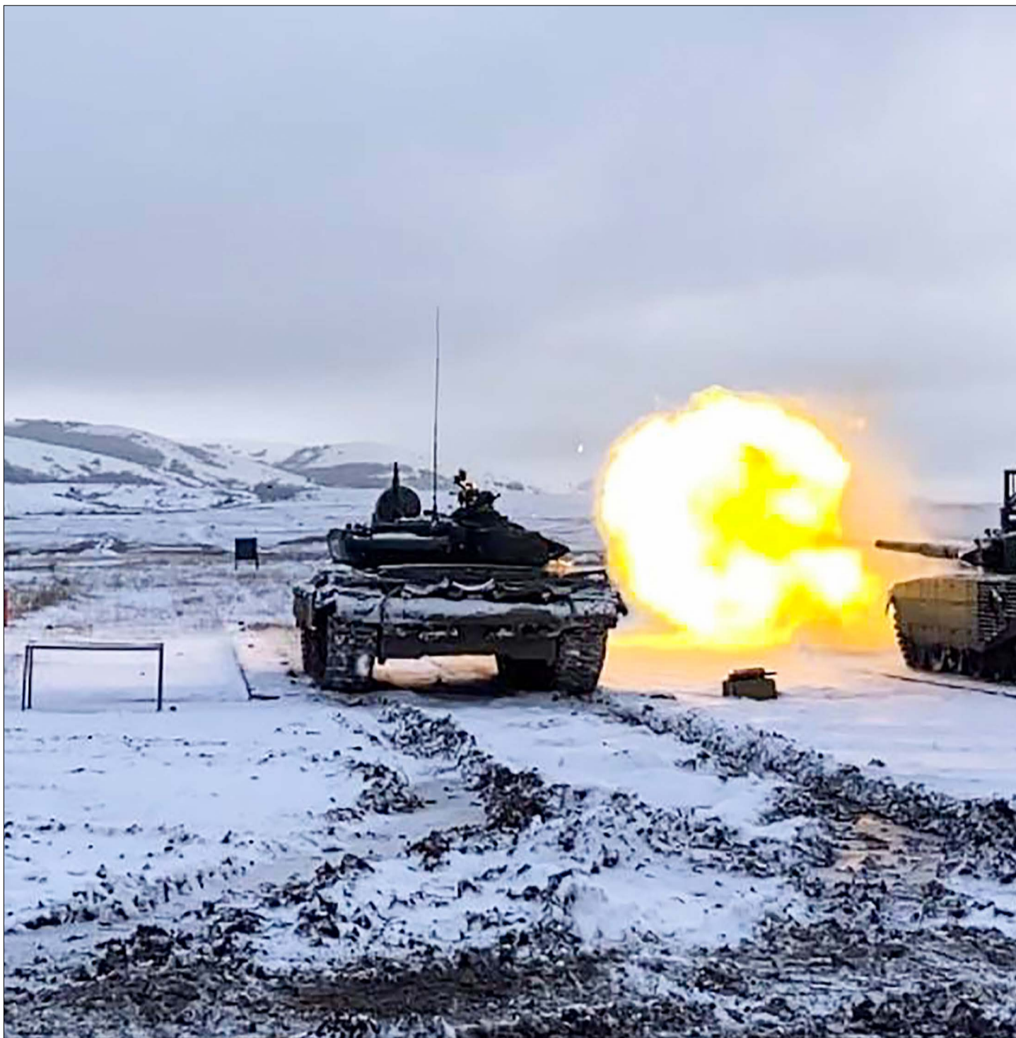
Отдельный танковый батальон береговой охраны – на страже Родины.