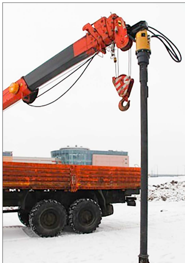
Установка, изготовленная по техническому заданию специалистов ООО «РемСервисТранспорт». / ФОТО: ДМИТРИЙ ЕПИФАНОВ, «ЕВС».

Специалистами ООО «РемСервисТранспорт» было проведено исследование работы установки АЗА на объектах заказчиков. Также были изучены возможные способы механизированного заворота-отворота якорей без применения агрегатов АЗА. В ходе данной работы определили, что функциональные характеристики АЗА