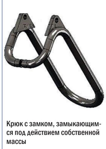
Крюк с замком, замыкающимся под действием собственной массы