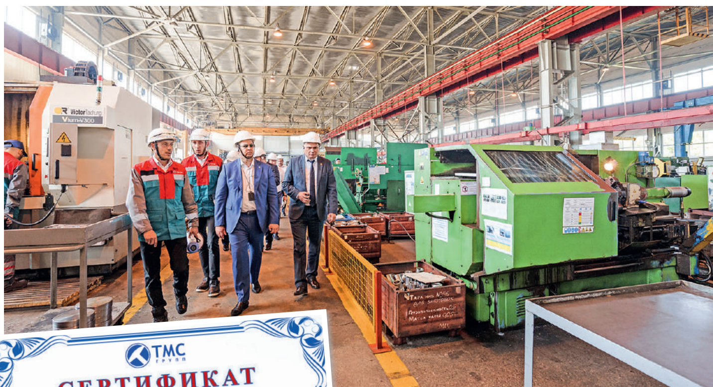
Практическая часть семинара по бережливому производству в механическом цехе

Эффективная реализация специалистами механического цеха проектов в области бережливого производства вносит достойный вклад в общие достижения Управления по развитию машиностроения в данном направлении. По итогам 2022 года коллектив Управления награжден в двух номинациях корпоративного конкурса.