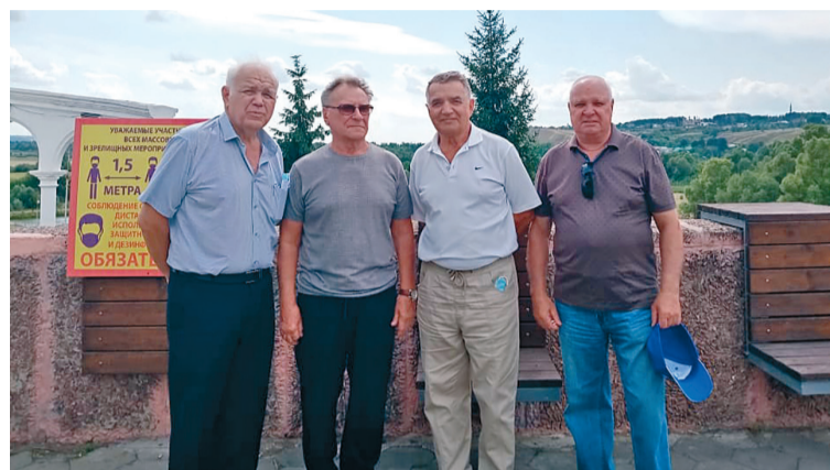
С народным артистом Сергеем Шакуровым