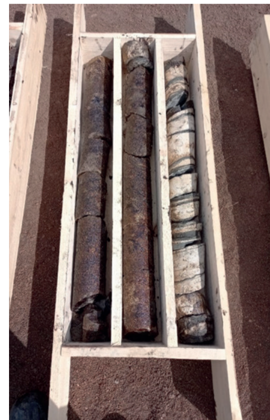
Керн со скважины 1122 Нагорного месторождения (глубина отбора 1878-1881 м)