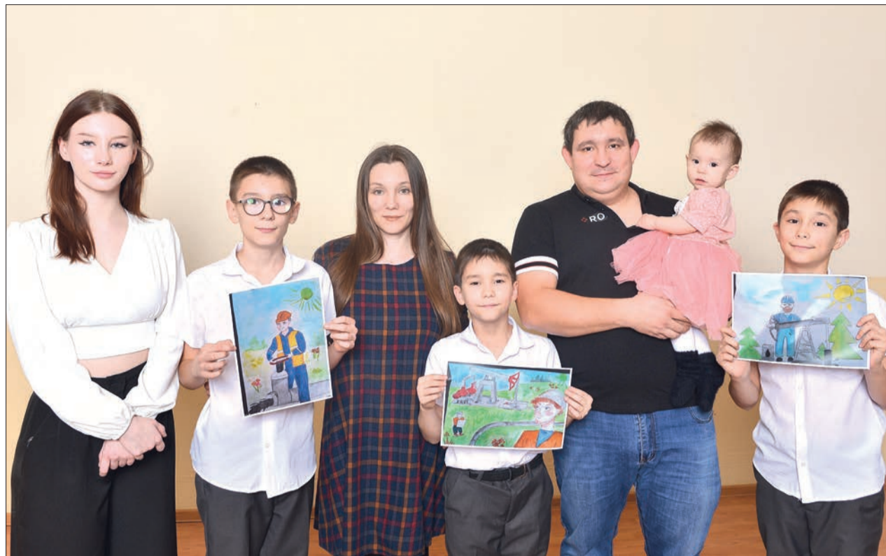
Дружная и многочисленная семья Шейкиных из ООО «ЦТ и РС» компании «ТаграС-РС».