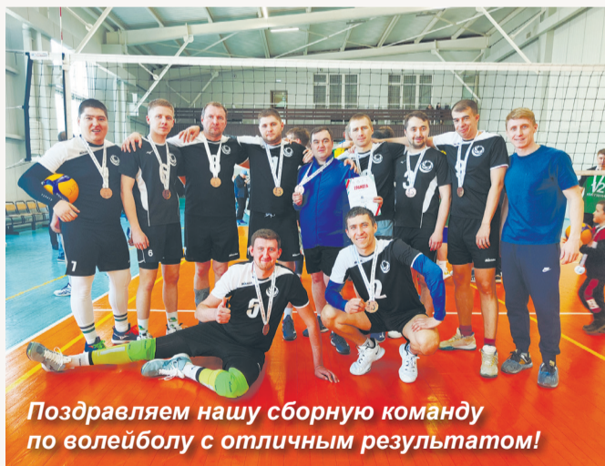
Поздравляем нашу сборную команду по волейболу с отличным результатом!

8 и 9 апреля состоялись «Спортивные соревнования Татнефти – 2023» по волейболу среди мужских команд. В них приняли участие 23 сильнейшие сборные предприятий, входящих в Татнефть Профсоюз.