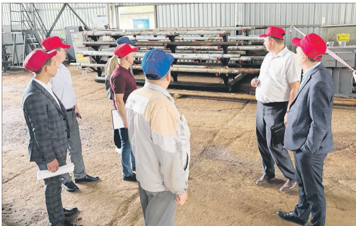
Перекрёстный аудит в цеху № 11 «Сервис НПО», г. Елабуга

Инструменты бережливого производства — лишь одно из направлений работы отдела совершенствования производственной системы ТНГ-Групп. В компании давно не понаслышке знают, что такое матрица компетенций, орга-