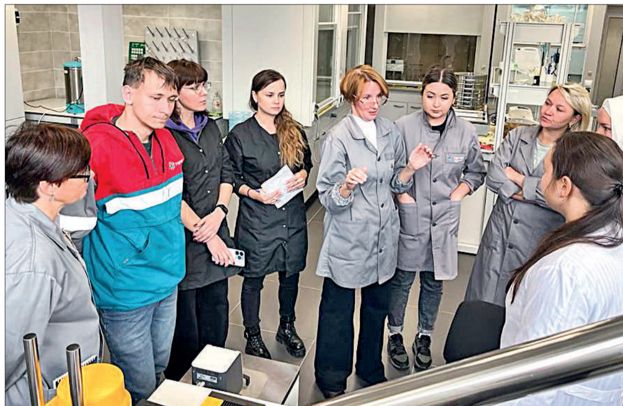
Лаборанты по ГРП получают знания на обучении в УГНТУ.