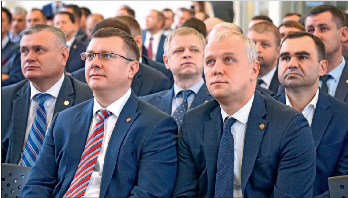
На семинаре по управлению инвестициями.