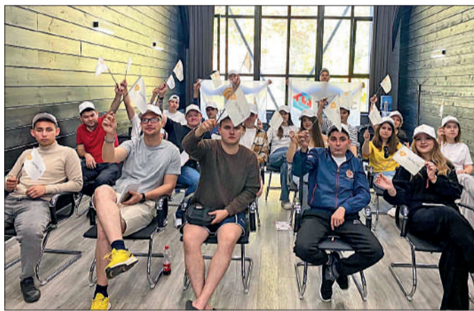
Участники поездки проводят время содержательно, строя планы на перспективу и обмениваясь опытом работы.