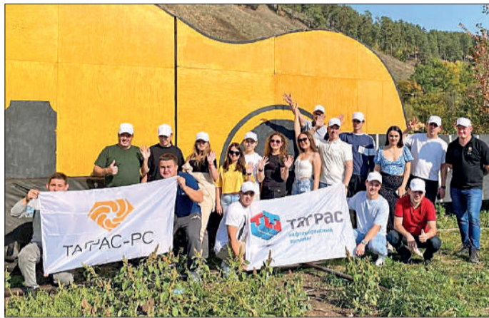
Молодежь компании на месте проведения Грушинского фестиваля бардовской песни.