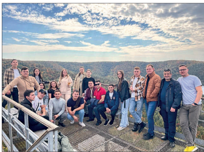
Активисты молодежного движения компании в тесном дружеском кругу на смотровой площадке.