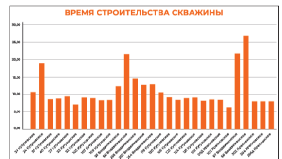
Время строительства скважин на месторождениях ООО «РИТЭК».

— Мы начали работы по бурению скважины № 1751 Енорусскинского месторождения заказчика «ТатРИТЭКнефть». У этого заказчика мы планируем бурить 6 скважин. Постараемся отработать быстро, эффективно и самое главное – безопасно! Для этого бригада полностью укомплектована оборудованием, и мы настроены на эффективную работу.