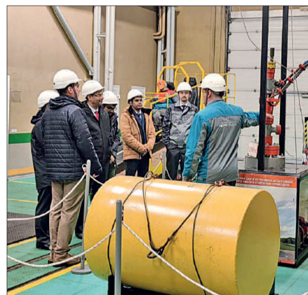
ООО «ТаграС-РС» посетила делегация из нефтяной компании Индии.