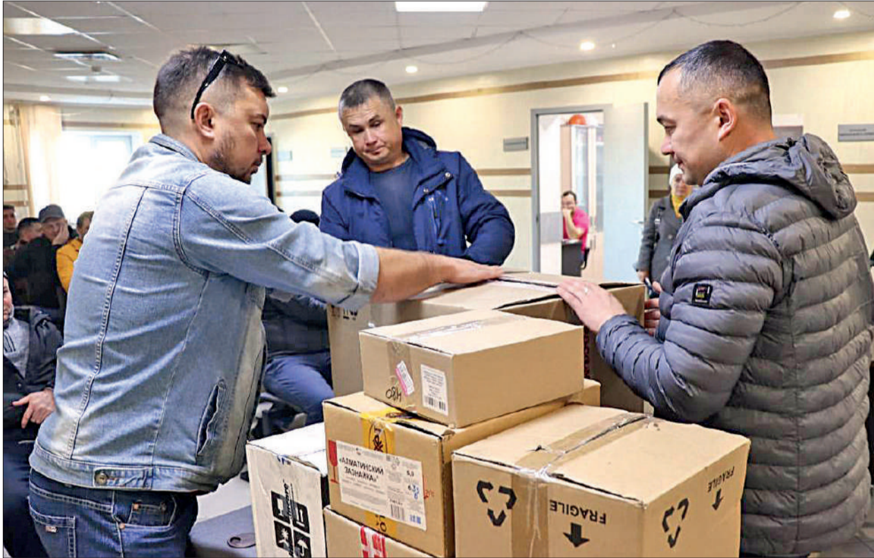
Коллектив ООО «ЦТ и РС» готовит гуманитарную помощь бойцам СВО – работникам компании.