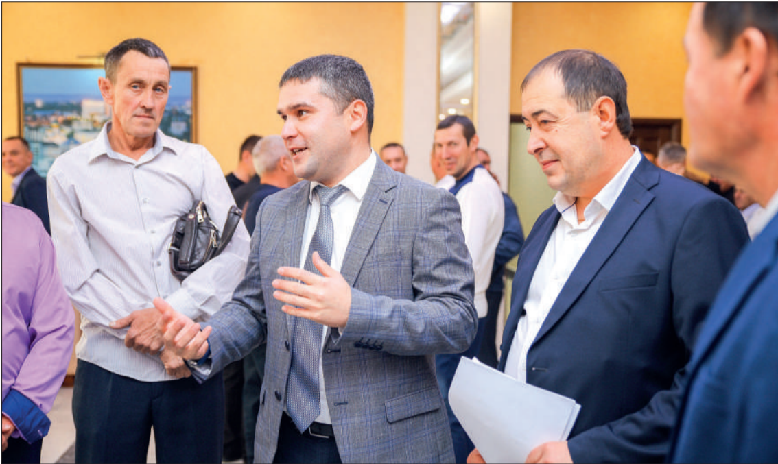
На Дне транспортника в режиме интерактива проходит продуктивное общение руководителей и рабочего состава.