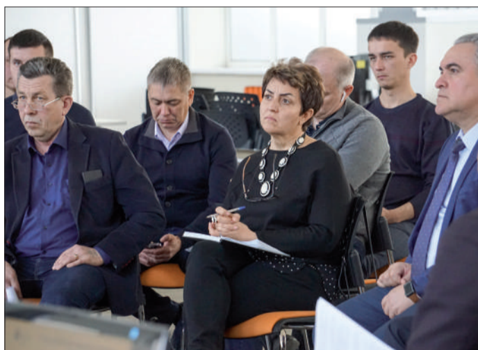
Специалисты подразделений компании делятся опытом работы с оборудованием, лучшими практиками и наработками.