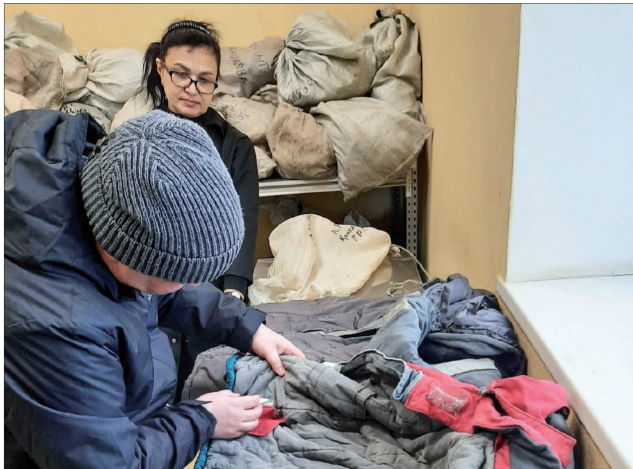
Успешно проведен аудит химчисток, которые на договоре подряда оказывают качественные услуги по чистке и ремонту спецодежды. / ФОТО: ДМИТРИЙ ЯКУШЕВ, «ЕВС».