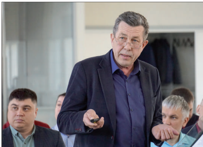
На семинаре задается много вопросов, касающихся работы оборудования и продления срока его работы.