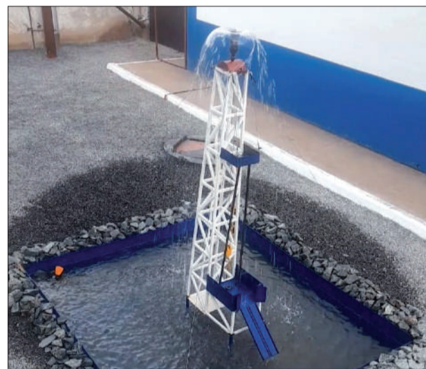
Импровизированный фонтанчик на территории – символ буровиков.

На рынке нефтесервисных услуг Предприятие ЗБС-Сервис находится на ведущих позициях, и у ряда заказчиков оказывает услуги как генеральный подрядчик. Нам доверяют работы, которые требуют «ювелирной» точности, ответственного подхода и высокого мастерства. Все это не раз было до-