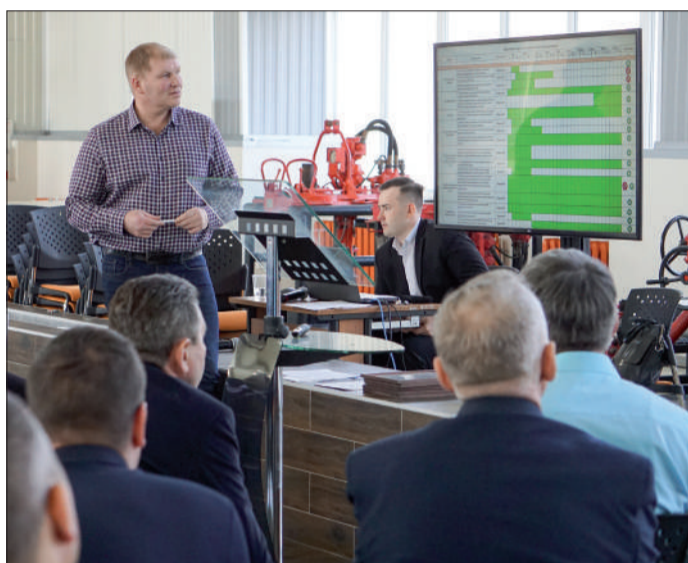
Докладчики много говорят о наработанном опыте и проблемах с оборудованием, которые необходимо решить в оперативном порядке.