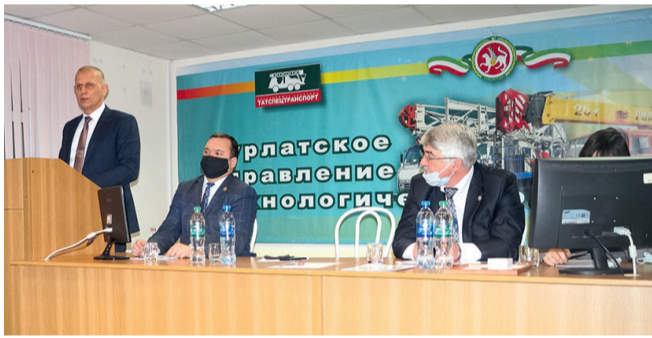
Итоги года подвели в Нурлатском УТТ

Во всех структурных подразделениях с 21 по 29 января 2021 года прошли итоговые собрания трудовых коллективов. Участники подвели итоги производственной деятельности, рассмотрели выполнение условий Коллективного договора в 2020 году, а также наметили задачи на 2021 год.