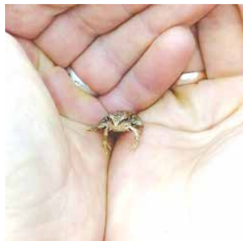
@ramillr04 Рамиль Файзуллин