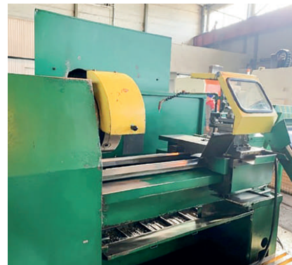
Токарный станок (стало)

Также механическим цехом решен еще один немаловажный момент – для безопасного пребывания на производственных площадках посетителей (проверяющих инспекторов, ИТР, работников спецорганизаций, водителей и др.) при входе в цех была организована зона, где установили крючки с дежурными касками.