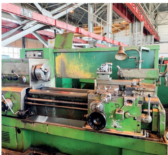
Токарный станок (было)

Для защиты оператора в области патрона разместили дугообразный защитный экран, с целью удобства он был изготовлен в виде откидной конструкции, которую можно легко поднять при смене детали или инструмента. Кроме того, подвижное и поворотное защитное ограждение установили на продольном суппорте токарного станка.