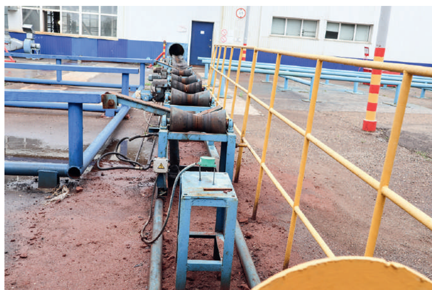
Защитное ограждение для трубной продукции

В ходе проведения реконструкции линии на участке выгонки готовой продукции не был заложен монтаж ограждения, его отсутствие создавало вероятность падения труб и возможность травмирования персонала. Специалисты цеха разработали конструкторскую документацию на изготовление оградительных элементов, своими силами они были изготовлены и установлены.