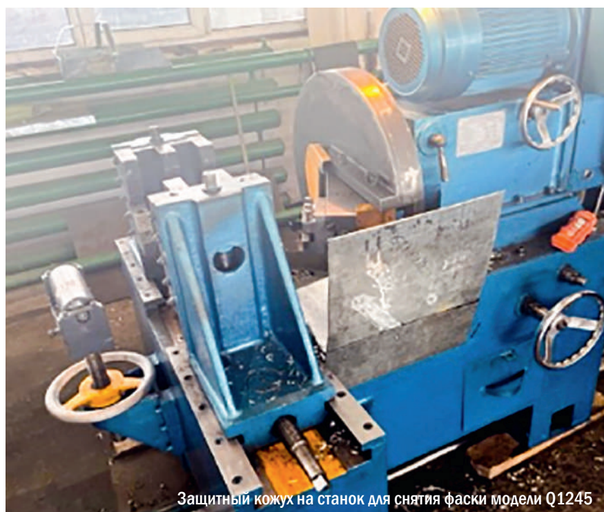
Защитный кожух на станок для снятия фаски модели Q1245

В заводской конструкции станка для снятия фаски модели Q1245 не был предусмотрен защитный кожух, что создавало вероятность травмирования органов зрения при проведении работ по обработке торцов труб. Для решения вопроса была разработана конструкторская документация на изготовление защитного экрана, своими силами изготовлен и установлен кожух.