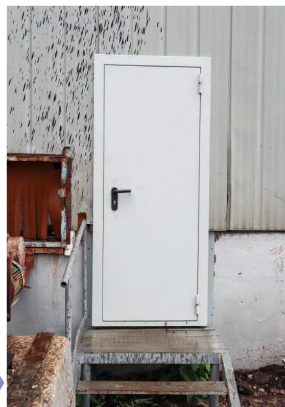
Дополнительный выход из помещения участка изготовления полиэтиленовых труб

Для исключения рисков было решено организовать дополнительный, более безопасный, выход из помещения участка.