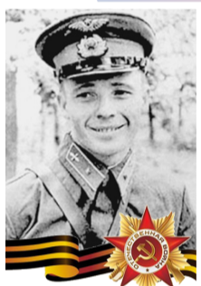
Виктор Васильевич ТАЛАЛИХИН

Родился 18 сентября 1918 года в селе Тепловка Вольского района Саратовской области.