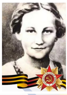
Зоя Анатольевна КОСМОДЕМЬЯНСКАЯ

Несмотря на то что Матросов был не первым, кто совершил подобный акт самопожертвования, именно его имя было использовано для прославления героизма советских солдат. Впоследствии свыше 300 человек совершили такой же подвиг, но это уже широко не освещалось. Звание Героя Советского Союза Александру Матвеевичу Матросову посмертно присвоено 19 июня 1943 года.