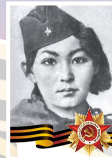
Алия Нурмухамбетовна МОЛДАГУЛОВА

1 марта 1944 года старшему сержанту Маншук Жиенгалиевне Маметовой посмертно присвоено звание Героя Советского Союза.