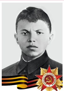
Александр Матвеевич МАТРОСОВ

Родился 5 февраля 1924 года в городе Екатеринославе (ныне Днепрпетровск). Рано лишился родителей, воспитывался в Ивановском детском доме (Ульяновская область), затем в Уфимской детской трудовой колонии. В действующей армии с ноября 1942 года.