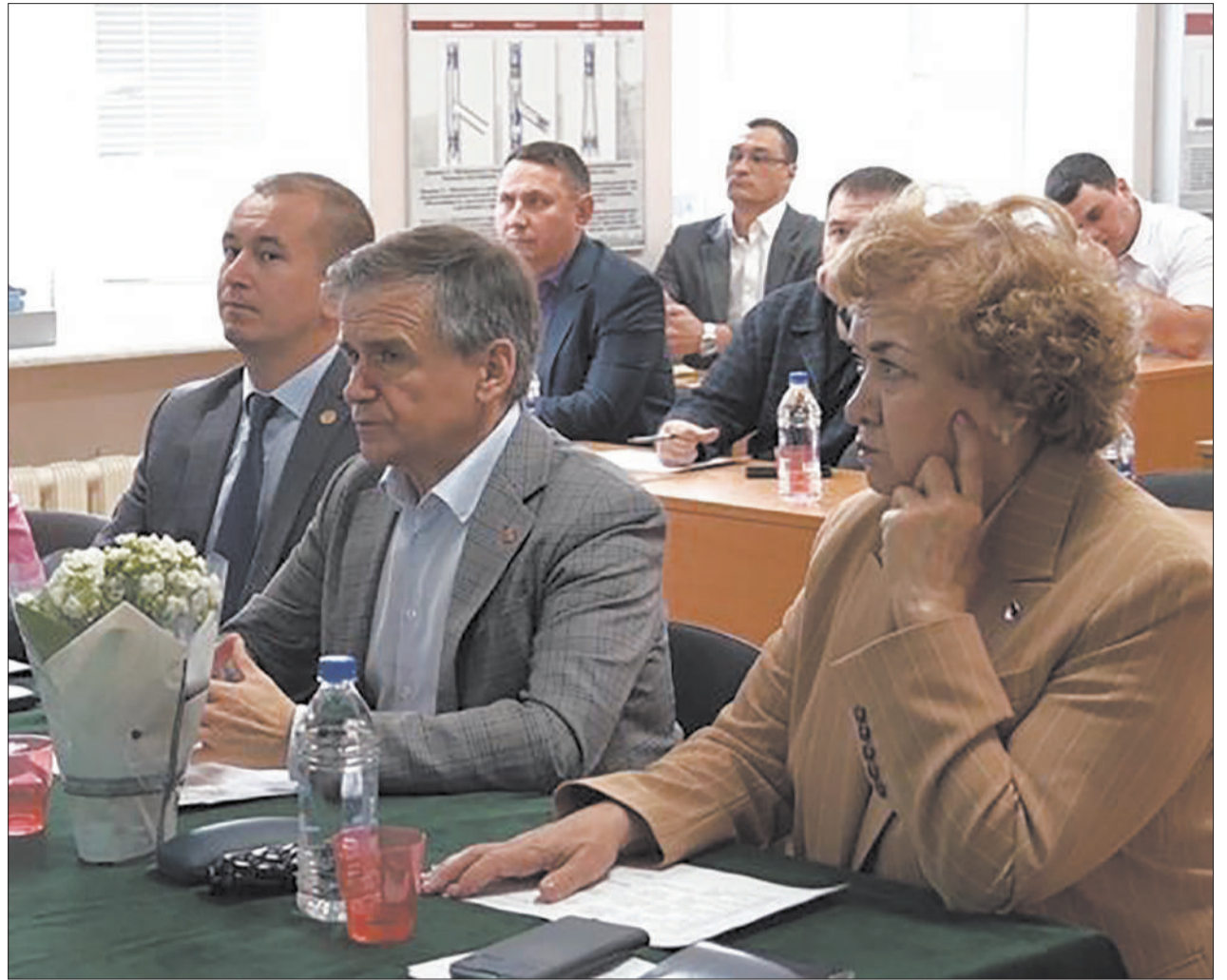
В комиссии по защите дипломных проектов выпускников АГНИ принимает участие директор ООО «ТаграС-РС».