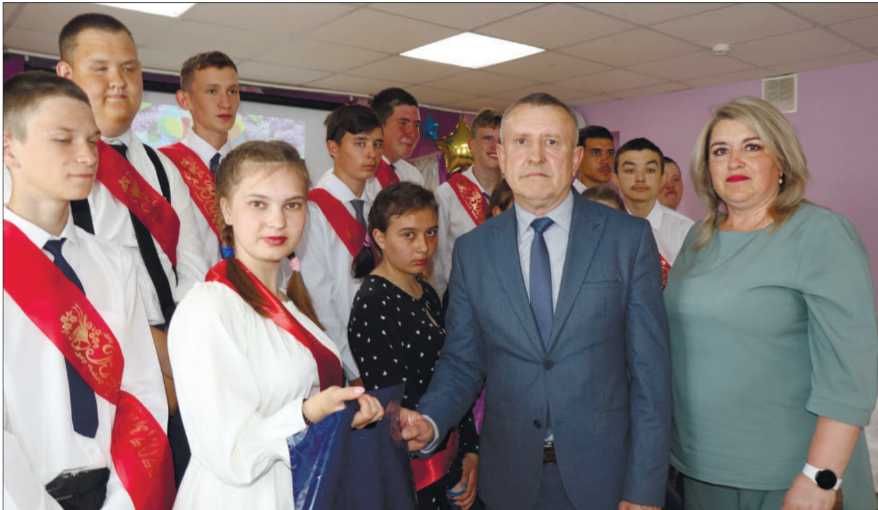
Выпускникам Нурлатской школы-интерната шефы — ООО «ЦТ и РС» сделали отличные подарки в качестве благодарительной помощи.