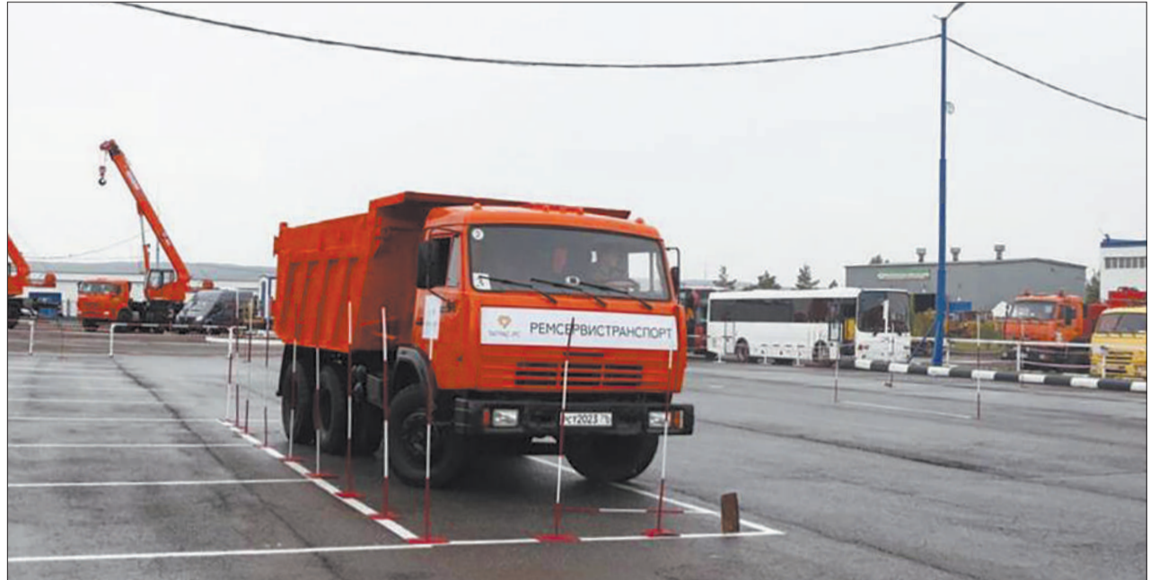
На конкурсе профессионального мастерства водители спецтехники показывают примеры отличного и безопасного вождения.